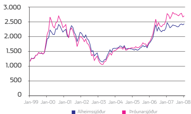
ERLENDIR SJÓÐIR - GENGISÞRÓUN

MARKMIÐ Fjárfestingar eru að hluta til í evrópskum hlutabréfum og á nýjum vaxandi hlutabréfamörkuðum.